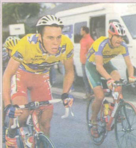
Kern : deux médailles d'argent pour relancer sa saison.