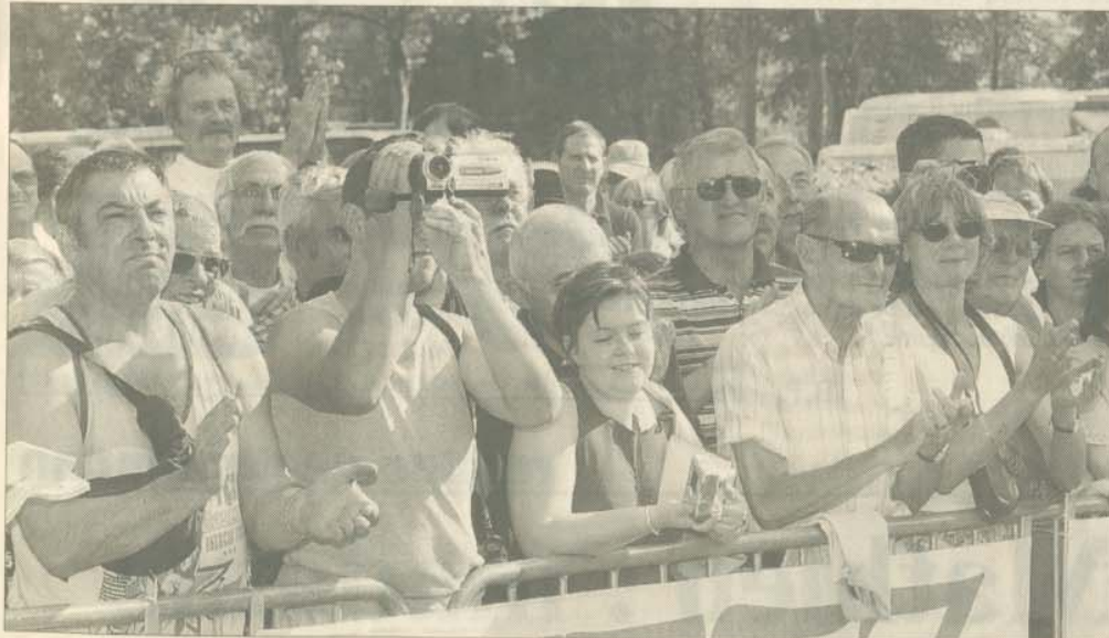
Des supporters derrière les barrières : « On n'a pas eu le Tour de France à Metz, mais on est content d'assister au Tour de l'Avenir. »

étape... » Une véritable ville dans la ville.